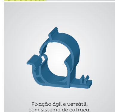
Fixação ágil e versátil, com sistema de catraca.