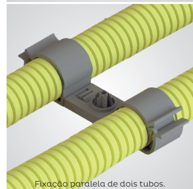
Fixação paralela de dois tubos.